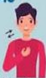
Dificultad al respirar